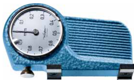
Sageschrank Käfer K 2/61