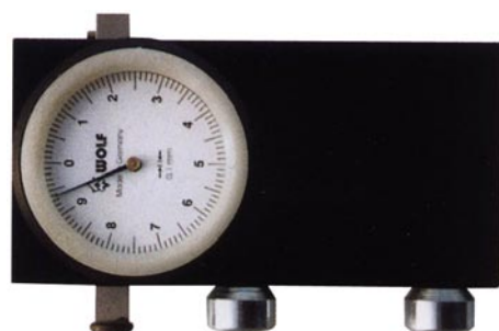
Sageschrank SM 5