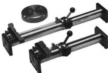
125 00000 (Schwenk)

Použití: přesné nastavování dutinoměrů. Přípravky jsou vhodné pro metrologická pracoviště, pro pracoviště kontrol nebo přímo ve výrobě při broušení otvorů v oblasti IT6. Bez koncových měrek.