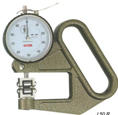
J 50 R