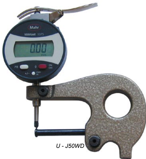
U - J50WD

Na poptávku válcový dotek \varnothing 6 mm nebo jiné typy.