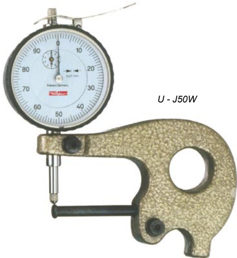
U - J50W