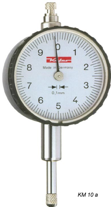
KM 10 a