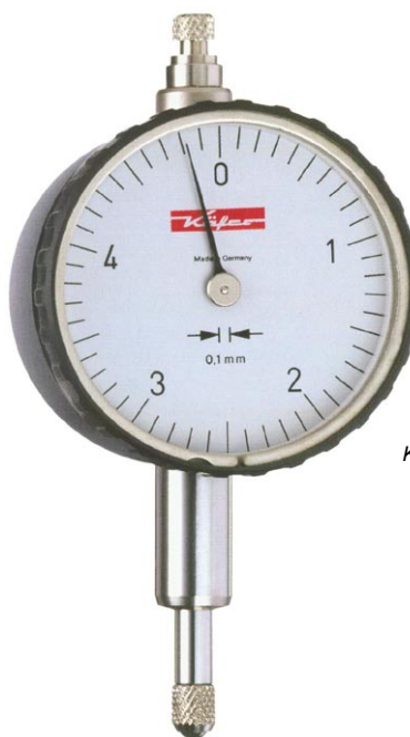
KM 5 a