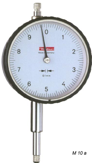
M 10 a