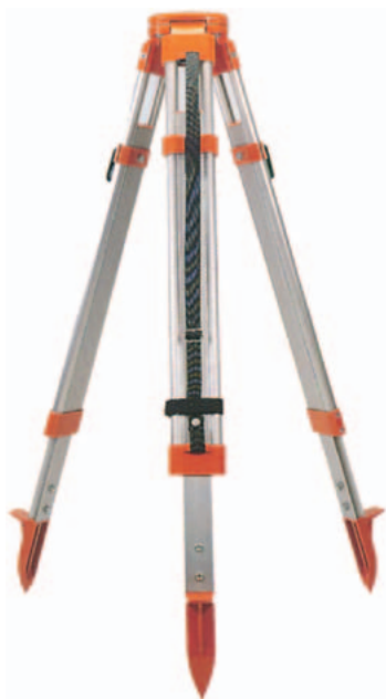
FS 20, 23

FS 20 lehký hliníkový stativ s rychlosvěrkami, \varnothing talíře stativu cca 110 mm, max. výška po vytažení 1,65 m, výška ve složeném stavu 1 m, hmotnost 3,9 kg