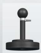
Výška: 154,5, Ø 126 mm