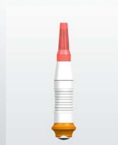
Výška: 154,5, Ø 126 mm