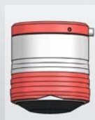
Výška: 74, Ø 66 mm