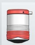
Výška: 72, Ø 50 mm