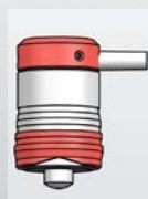
Výška: 47, Ø 28 mm