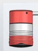
Výška: 69, Ø 46 mm